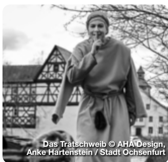
Das Trätschweib