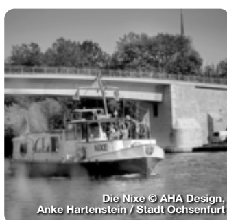
Die Nixe © AHA Design, Anke Hartenstein / Stadt Ochsenfurt