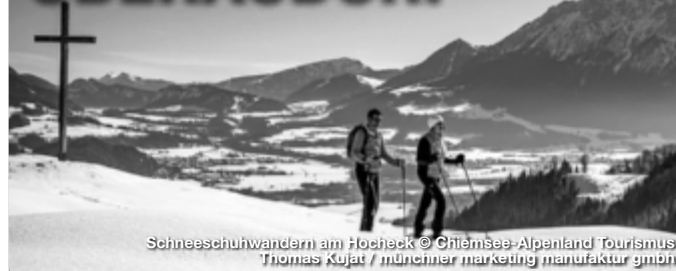
Schneeschuhwandern am Hoheck

Wenn die Wintersonne den Schnee glitzern lässt, als wären tausende von Diamanten verstreut. Wenn die weiße Pracht das Herz des Wintersportlers höherschlagen lässt und das atemberaubende Bergpanorama einem die Sprache verschlägt - dann beginnt er: der Winter im idyllischen Oberaudorf. Der kleine Luftkurort Oberaudorf im Voralpenland bietet jede Menge Wintererlebnisse fern ab von großen Touristenmassen. Zur Auswahl stehen bestens präparierte Pisten, kurvenreiche Rodelbahnen, aussichtsreiche Langlaufloipen sowie spannende Fackelwanderungen. Wellnessangebote, Gaumenfreuden und diverse Einkaufsmöglichkeiten machen Oberaudorf zu einem optimalen und einzigartigen Winter-Urlaubsort.