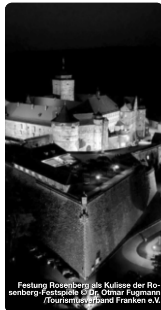
Festung Rosenberg als Kulisse der Rosenberg-Festspiele

Zwischen Mai und August 2022 verwandelt sich die Festung Rosenberg hoch über Kronach in die imposante Freilicht-Bühne der Rosenberg-Festspiele. Das Programm, für das der Ticket-Verkauf bereits gestartet ist, verspricht einen fulminanten Theatersommer voller starker Stücke. So setzen die Festspiele mit Schillers „Maria Stuart“ auf einen spannungsgeladenen Klassiker der Theaterliteratur, in dem zwei Herrscherinnen in einem machtbesessenen Umfeld zu Rivalinnen und schließlich zu Tödefeindinnen werden. TreffpunktDeutschland.de/kronach