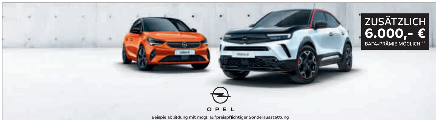
Beispielabbildung mit mögl. aufpreispflichtiger Sonderausstattung

Königsbrunn Haunstetter Str. 57 Tel. (08231) 86033